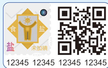
未加碘食盐标码合一标志